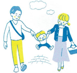
お子さまのお出かけの際に