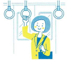
オフィスや通勤時に